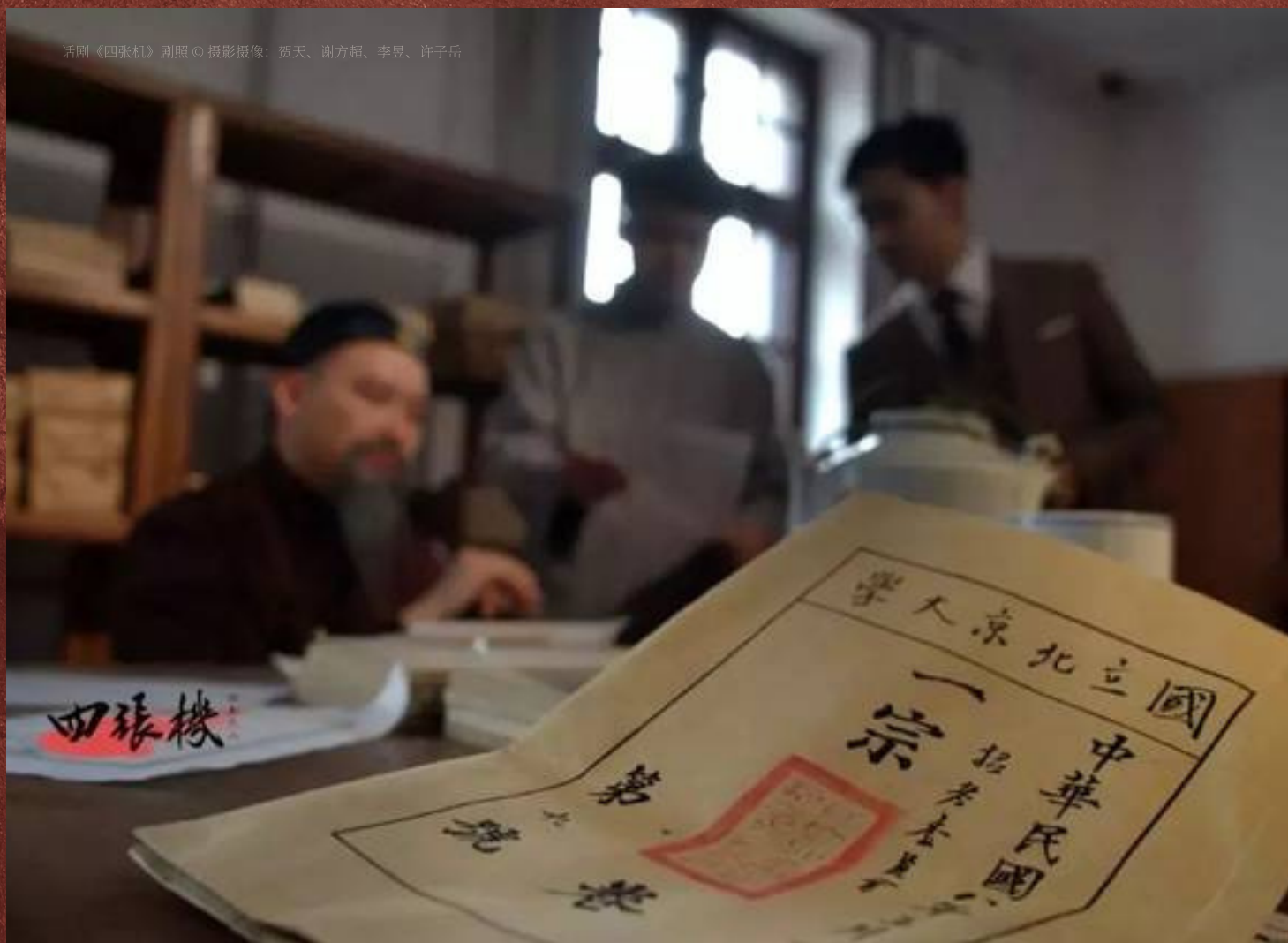
话剧《四张机》剧照

整台演出都是牛人，炫技炫得人舒舒服服。唱的是著名音乐剧的著名唱段，乐曲之间没有太大关联，主创却用非常有意思的小桥段幽默又不做作地将整场演出串联在一起，形成了一出迷你版戏中戏。回忆起来，那真是一个美好又赏心悦目的夜晚。